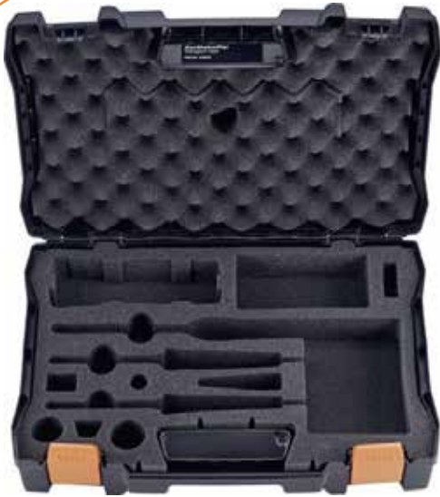
MALLETTE VIDE POUR THERMOMÈTRE