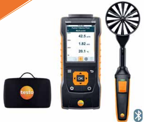
KIT MULTI-FONCTIONS 440

Kit comprenant Testo 440 1 sonde à hélice Ø100 mm avec bluetooth et capteur de température 1 sacoche de transport Compact, sans fil, intuitif, fiable ! Découvrez le Testo 440 : appareil multifonctions pour l'aéraulique !